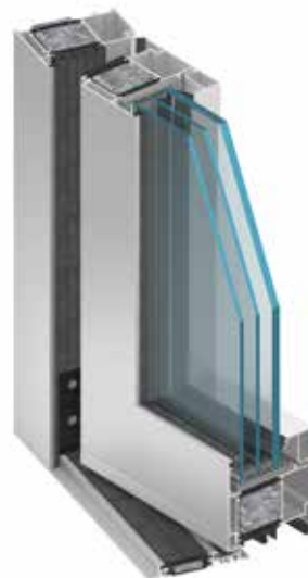
Tür MB-104 Passive SI, RC3

Beispiele für den Wärmedurchgangskoeffizienten U_D