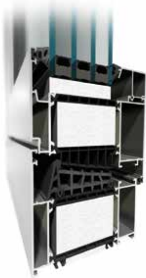
MB-104 Passive Aero