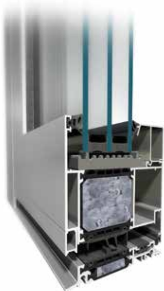
Tür MB-104 Passive SI