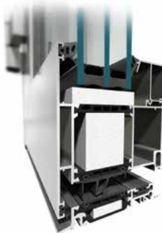
Tür MB-104 Passive Aero