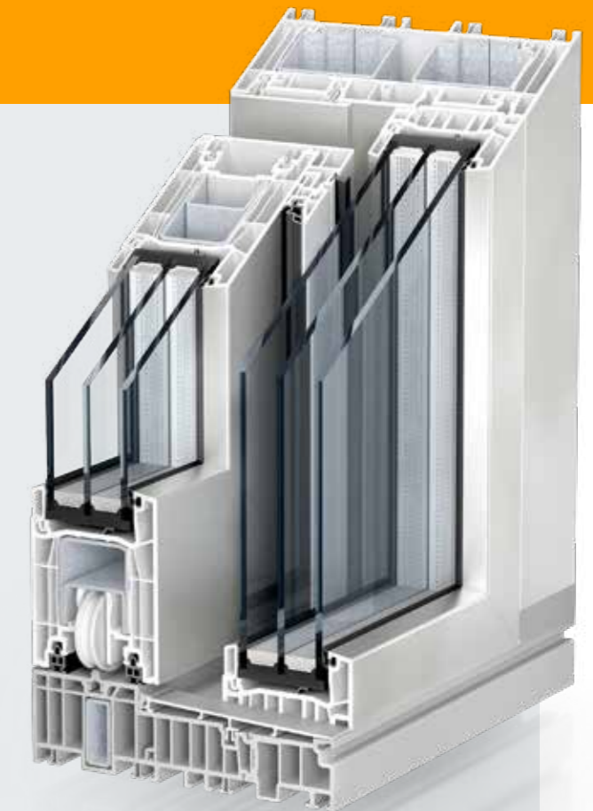
Kömmerling PremiDoor 76 Lux