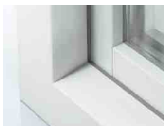
Schüco LivIng Variant HVL met een 15° als onderste kader en 6° als zijkader

Het kunststof systeem Schüco LivIng Variant is een innovatief 6-kamersysteem. Het systeem staat garant voor onovertroffen thermische isolatie en smalle aanzichtbreedtes.