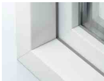
Schüco LivIng Variant in verstek met een omlopende kader contour van 15°