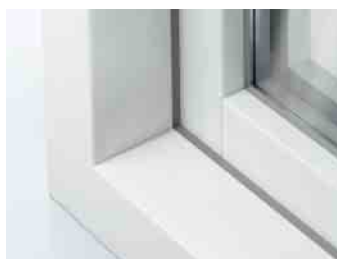
Schüco LivIng Variant HVL met een 15° als kader contour